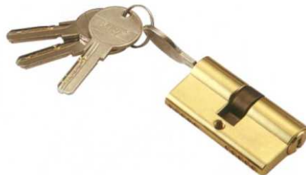
鎖芯 B 功能: 兩邊帶匙 可單邊帶匙