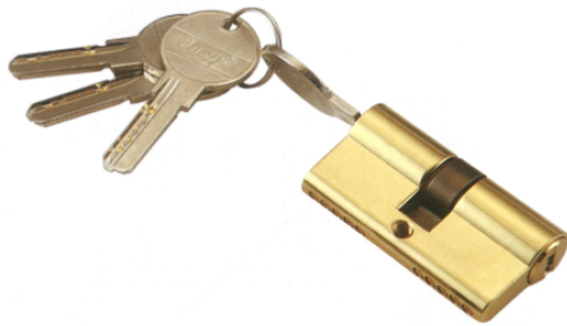
鎖芯 B 功能: 兩邊帶匙 可單邊帶匙