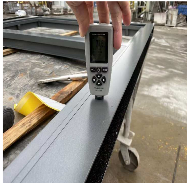
铝窗镀膜厚度数值为 77.6