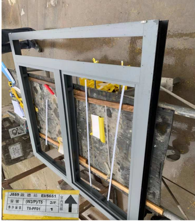
铝窗编号：T5 W3/P 铝窗撕开胶纸检查