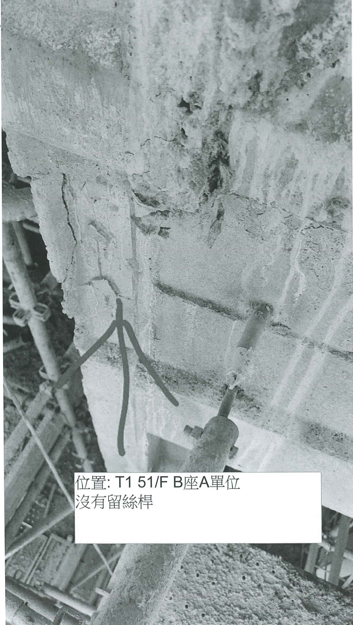
位置: T1 51/F B座A單位 沒有留絲桿