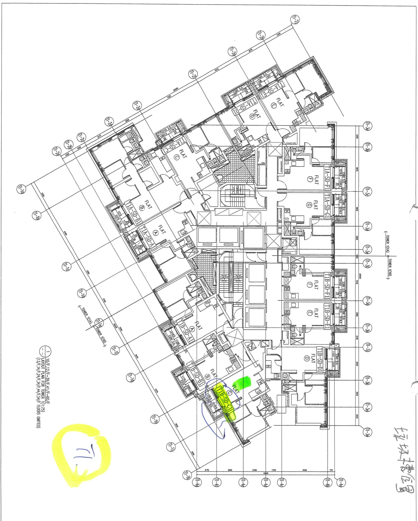
10/F, 12/F, 39/F, 41/F, 60/F LAYOUT PLAN FOR TOWER 11 (1:75) (13/F, 14/F, 24/F, 34/F, 44/F, 54/F FLOORS OMITTED)